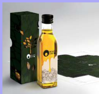
Etichette e prototipi di packaging