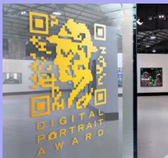
Grafiche per vetrine

Per migliorare il caricamento del materiale, i plotter da taglio GR dispongono di pinch roller elettronici, che hanno più di 10 modalità di settaggio della pressione, per tenere anche i materiali più difficili, come floccati, oscuranti per vetri e materiali riflettenti spessi.