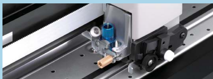
Doppio alloggiamento portalama.

Con una velocità di taglio pari a 1485 mm al secondo, la serie CAMM-1 GR vanta la più alta velocità di produzione nella sua categoria. Il carrello di taglio ottimizzato aumenta la produttività e riduce al minimo la distanza verticale che la lama deve percorrere. Inoltre avanzati strumenti per la creazione di linee guida aiutano l'utente nella fase di spellicolatura del lavoro.