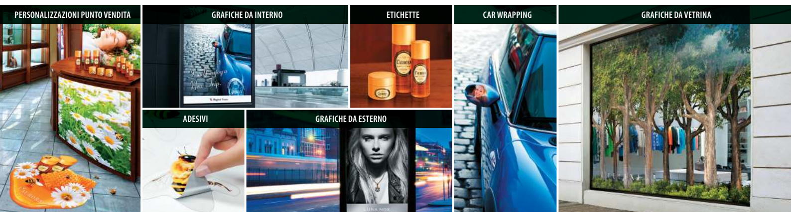
PERSONALIZZAZIONI PUNTO VENDITA

Sono disponibili più di quaranta materiali differenti in commercio dai maggiori costruttori con cui è possibile realizzare più di cinquanta applicazioni grafiche per andare su oltre cinquanta mercati differenti.