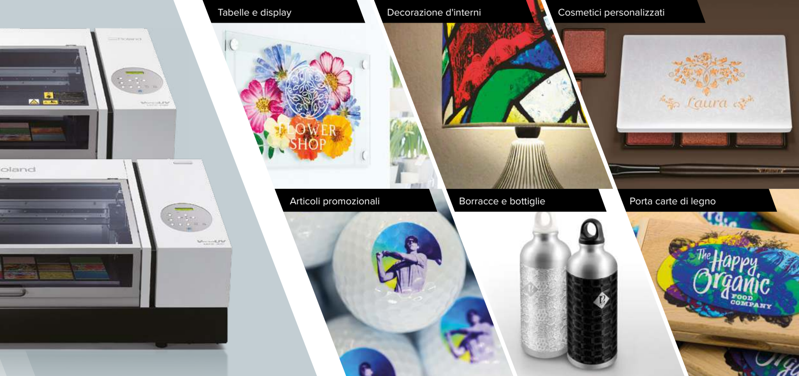
Tabelle e display