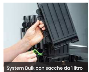
System Bulk con sacche da 1 litro