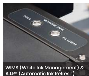
WIMS (White Ink Management) & A.I.R.® (Automatic Ink Refresh)