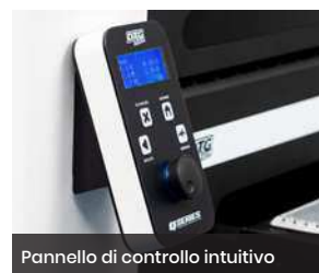
Pannello di controllo intuitivo