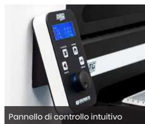
Pannello di controllo intuitivo