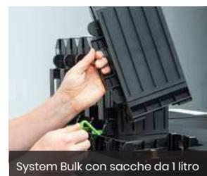
System Bulk con sacche da 1 litro