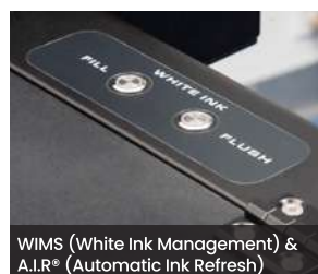
WIMS (White Ink Management) & A.I.R.® (Automatic Ink Refresh)